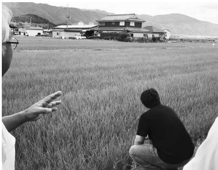
原種農場を見学し種子生産の大切さを学ぶ全農協労連の仲間

そもそも、種子法というのは、稲、麦、大豆を「主要農作物種子法」として安定供給するために、国の責任を明記したものです。この法律のもとで、都道府県が地域の気候風土にあった優良な品種を育ててきました。